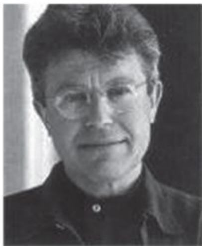
柏林犹太博物馆设计者： Daniel Libeskind